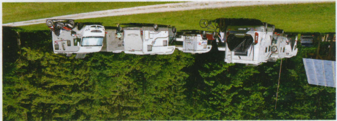
Sredi narave v Kamniški Bistrici: piknik prostor pri Jur'ju.