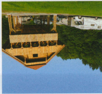
S pogledom na Bogensperk: gostilna in rekreacijski prostor Pri Rozi.

V prvo karavanning destinacijo pri nas se je doslej vključilo že 18 ponudnikov, popotnikom pa bo v pomoč