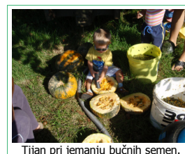
Tijan pri jemanju bučnih semen.