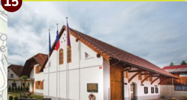
16 REKREACIJSKA OS OB KAMNIŠKI BISTRICI