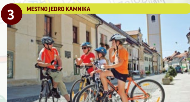
3 MESTNO JEDRO KAMNIKA