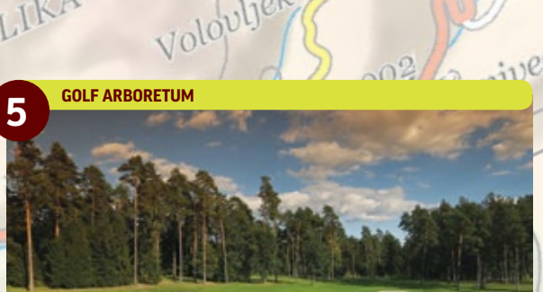
5 GOLF ARBORETUM