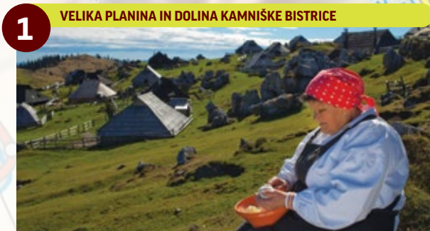
1 VELIKA PLANINA IN DOLINA KAMNIŠKE BISTRICE