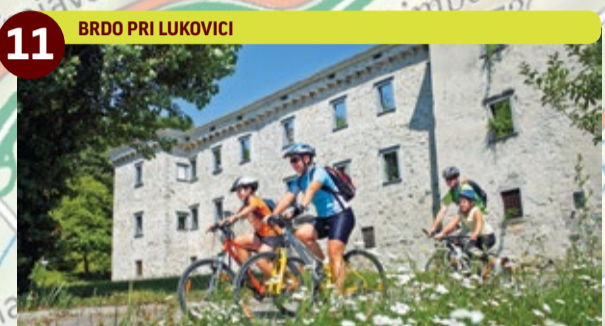
11 BRDO PRI LUKOVICI