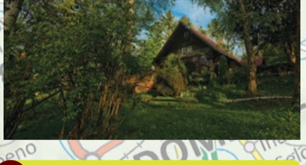
3 MESTNO JEDRO KAMNIKA