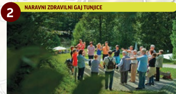
2 NARAVNI ZDRAVILNI GAJ TUNJICE