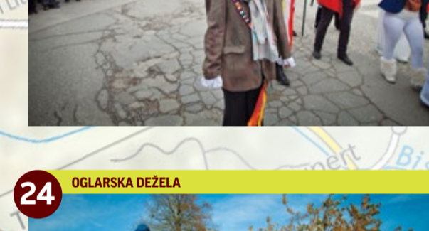
24 OGLARSKA DEŽELA