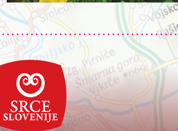
8 CERKEV SV. MIHAELA