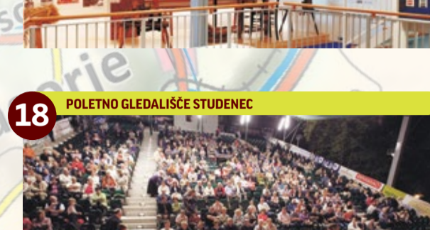
18 POLETNO GLEDALIŠČE STUDENEC