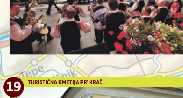
19 TURISTIČNA KMETIJA PR' KRAČ