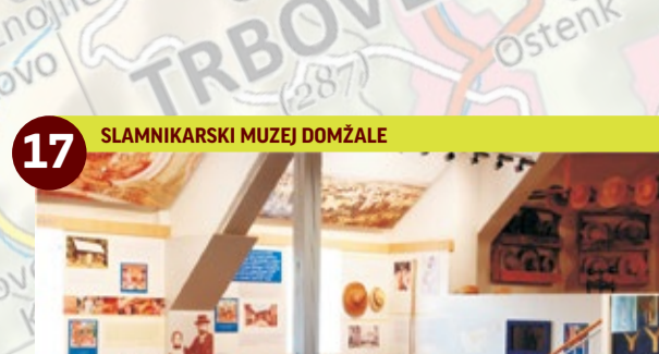
17 SLAMNIKARSKI MUZEJ DOMŽALE