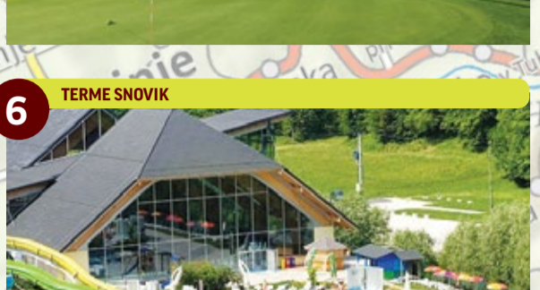
6 TERME SNOVIK