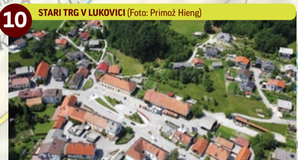
10 STARI TRG V LUKOVICI