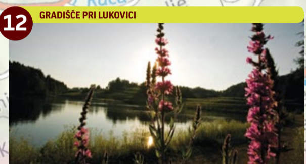
12 GRADIŠČE PRI LUKOVICI