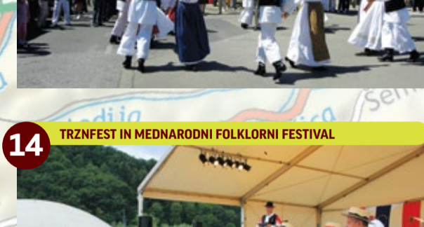
14 TRZNFEST IN MEDNARODNI FOLKLORNI FESTIVAL