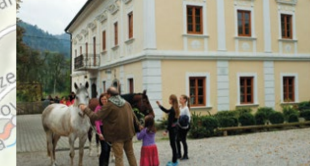
20 VEGOVA UČNA POT