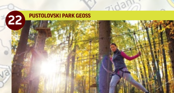
22 PUSTOLOVSKI PARK GEOSS