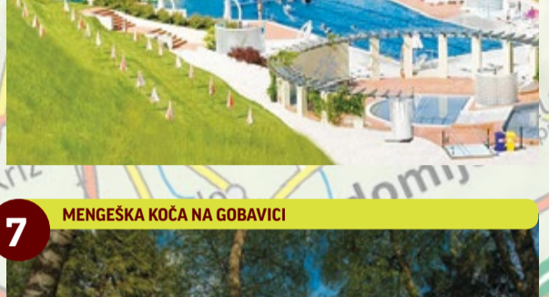
7 MENGEŠKA KOČA NA GOBAVICI