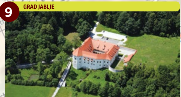
9 GRAD JABLJE