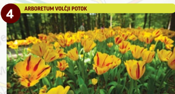
4 ARBORETUM VOLČJI POTOK