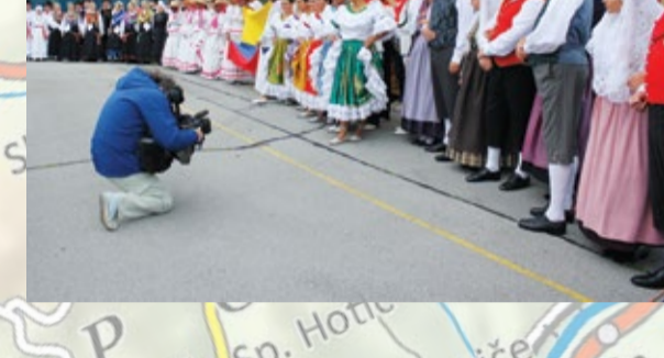
15 JEFAČN'KOVA DOMAČIJA