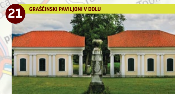
21 GRAŠČINSKI PAVILJONI V DOLU