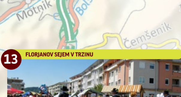
13 FLORJANOV SEJEM V TRZINU